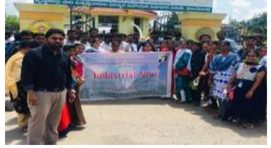
MBA students @ Vijaya Dairy

> II year students made an Industrial visit to Vijaya Dairy on 28^{th} Sep 2019.