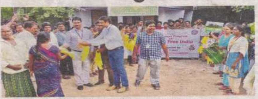
ప్రజలకు జ్యూట్ బ్యాగ్లు పంపిణీ చేస్తున్న కళాశాల నిబృంది, విద్యార్తులు

మైలవరం, సెప్టెంబరు 30 : ప్రాస్థిక్ రహిత సమాజానికి (పతి ఒక్కరూ కృషి ນີ້యాలని లకిరెడి ສະຍວີడి ສວະນີ້ຍິວກົ కళాశాల ప్రవృపాల్ కె అస్పారావు పేర్కె న్నారు. సోమజారం కళాశాల ఎన్ఎస్ఎస్ యూనిటి ఆధ్యర్యంలో పట్టణంలోని పరవీదుల్లో ప్రాస్థికొపై అవగాహన ర్యాలీ నిర్వహించారు. ప్రాస్టింగ్ వినియోగం వల్ల కలిగే నష్టాలు, అనర్మాలు, పర్యావరణ పరిరక్షణకు తీసుకోవాల్సిన జాగ్రత్తల పై స్రహుజతు ఆవగాహన కల్పించారు. ఈ సందర్భంగా (ఫిస్సిపాల్ మాట్లాడుతూ పర్యావరణ పరిరక్షణకు ప్రాస్టిక్ పెను ముచ్చుగా మారిందని, విరివిగా ప్రాస్టిక్ వినియోగిన్నన్న నేపథ్యంలో అనేక నమన్యలు ఉత్పన్నమవతున్నాయని (పతి ఒక్కరూ సామాజిక బాద్యతగా ప్రాస్టిక్ వాడకాన్ని